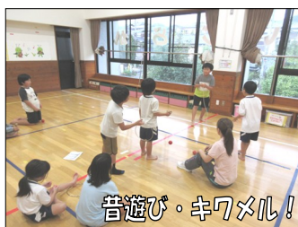
音遊び・キワメル!