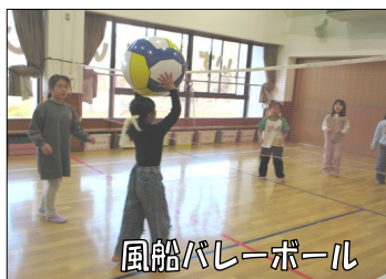
風船バレーボール